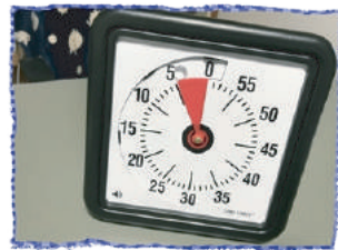
(残り時間タイマー)

ツリーハウスでは未就学で発達に心配のあるお子さんに 児童発達支援事業 ・障がいのある児童・生徒に安心することができる環境を提供する 放課後等児童デイサービス を戶外遊び、リミックなど遊びを通して成長を助けます。保育士や専門の作業療法士のスタッフも常駐しひとりひとりに合わせた集団活動が出来るように指導するみたいです。ころころHappyのメンバーによるピアカウンセリング・ピアサポートも今後開催するみたいです。