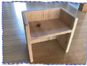
(子どもに合わせて2段階に)